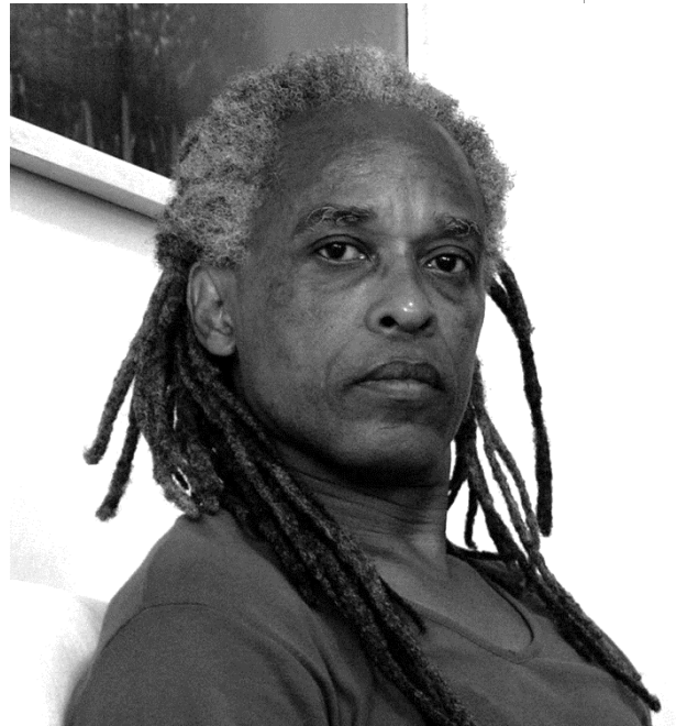
RENÉ PEÑA La Habana, 1957

Se trata posiblemente del fotógrafo más importante de Cuba en la actualidad. Autodidacta, es miembro de la Unión de Escritores y Artistas de Cuba y del Consejo Asesor de la Fototeca de Cuba. Actualmente vive y trabaja en La Habana.