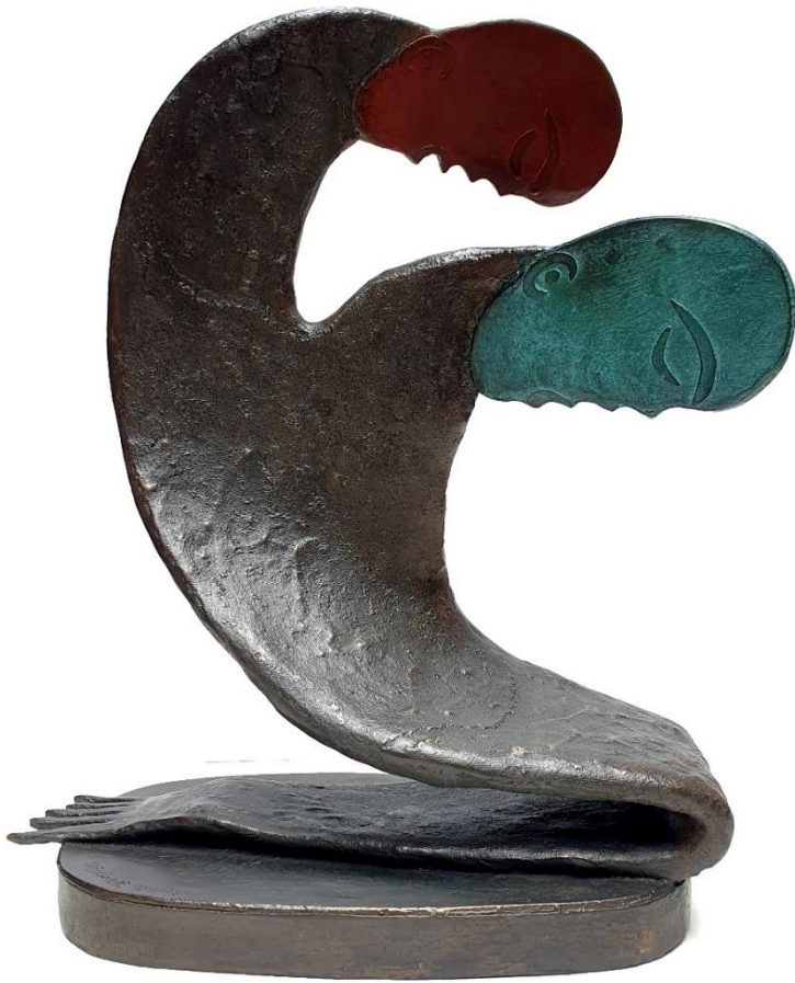
MANUEL MENDIVE Dentro de mi (2019) Bronce Ed. 7, 47 x 40 x 20 cm.