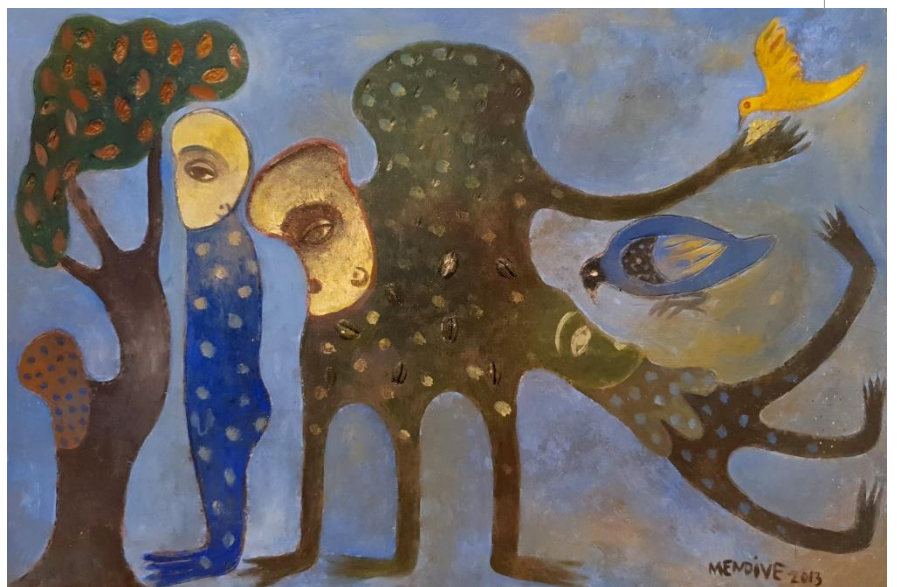
MANUEL MENDIVE Pequeñas fugas (2013) Acrílico y caracoles sobre madera, 34 x 48 cm.