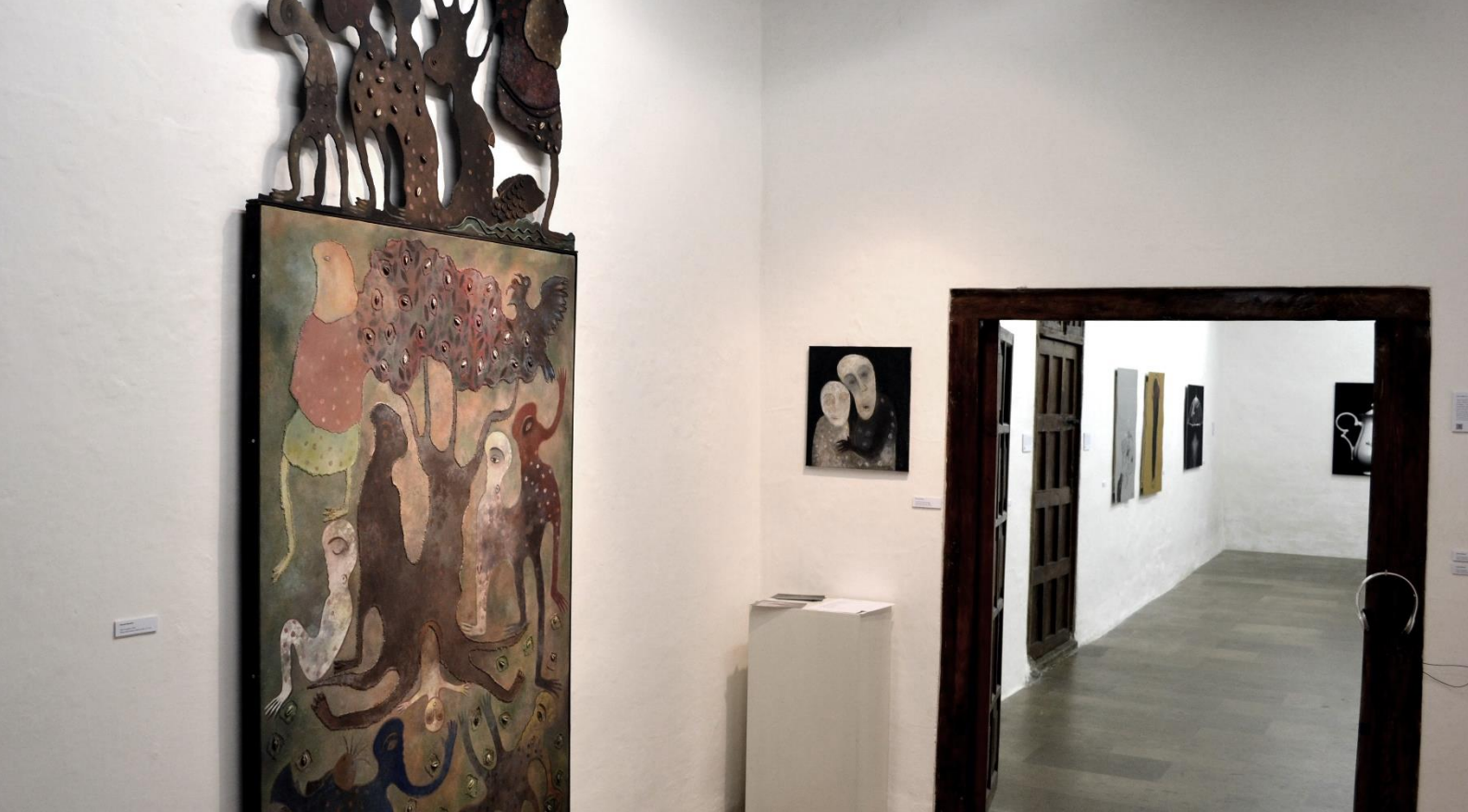
Montaje de Aires de Cuba en Galería Artizar (2015)