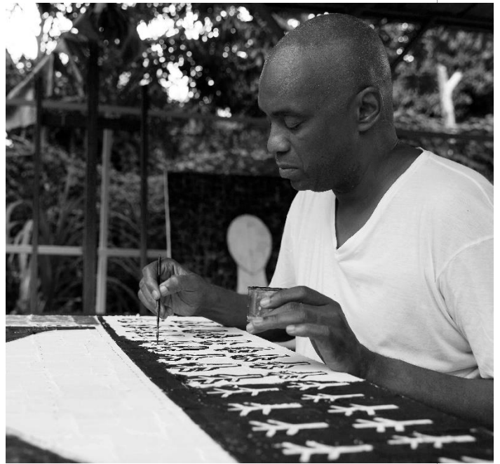
ROBERTO DIAGO La Habana, 1971

Roberto Diago es uno de los más reconocidos artistas contemporáneos en Cuba. Nacido en 1971, se formó en la Academia de San Alejandro en 1990 y se desempeña como Profesor Consultante del Instituto Superior de Arte, La Habana.