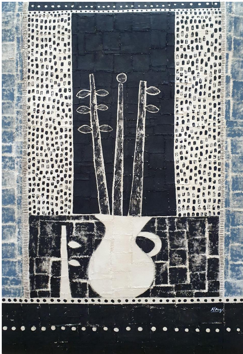
ROBERTO DIAGO Flores para el alma (2019) Técnica mixta sobre lienzo, 100 x 70 cm.