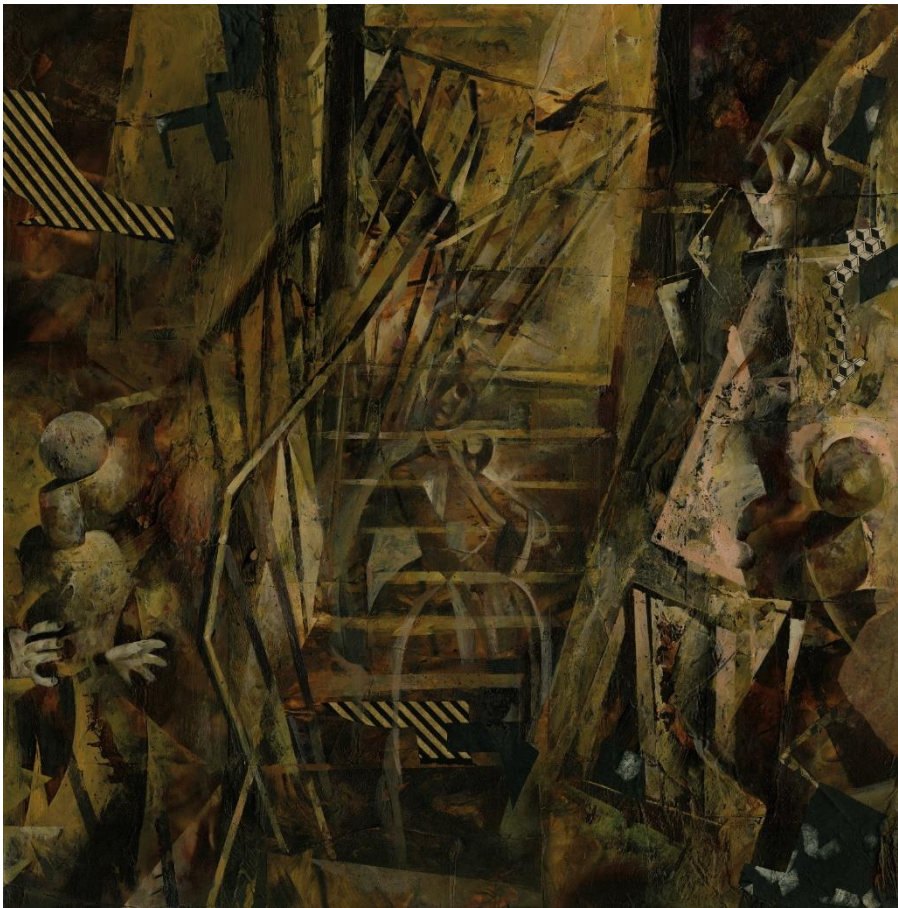
Raskolnikow / Crimen y Castigo (Robert Wiene) 1923 Acrílico, collage y tierra sobre panel. 2020. 63 x 63cm