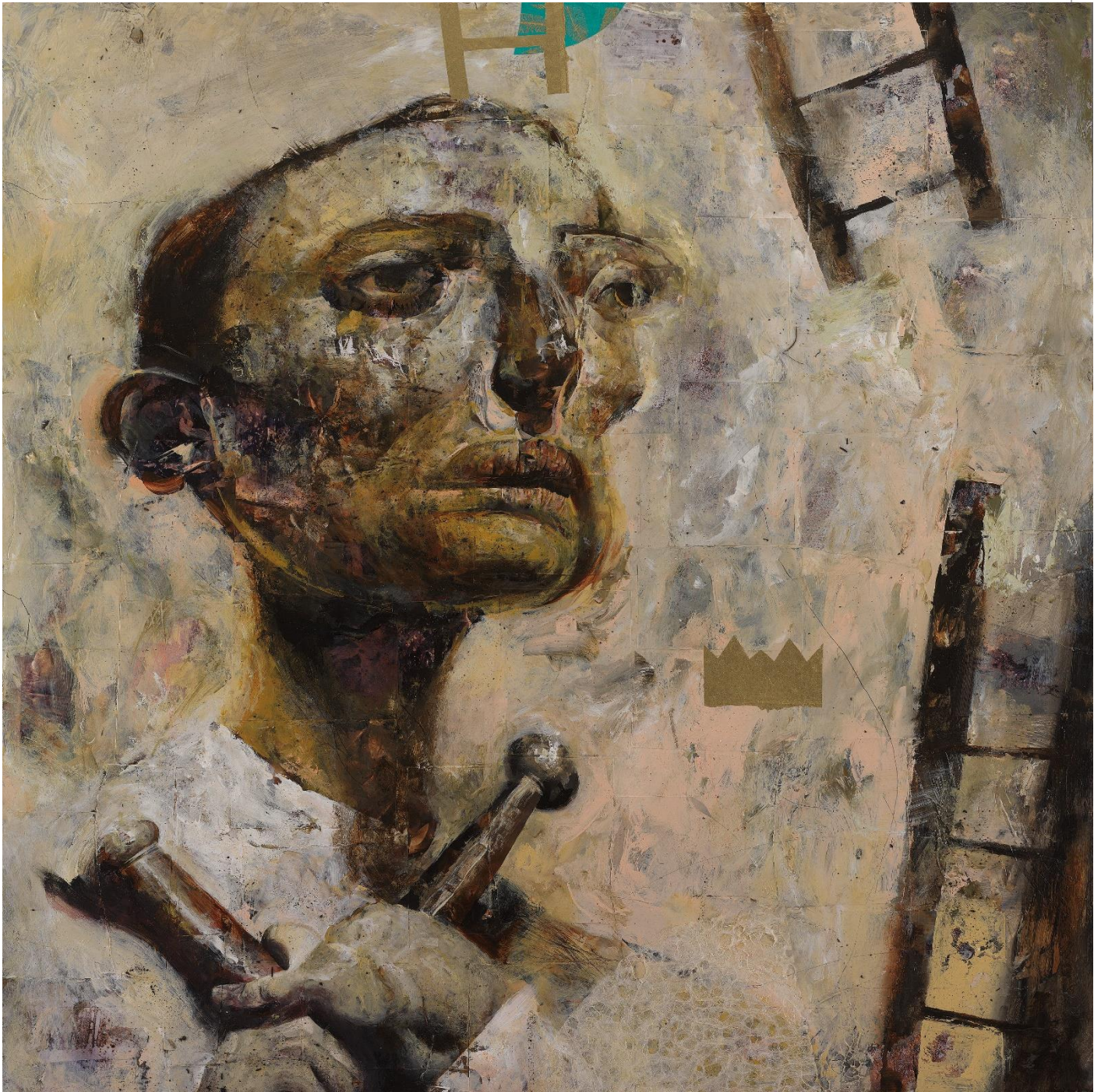
La Pasión de Juana de Arco (Carl Theodor Dreyer) 1928 Acrílico, collage y tierra sobre panel. 2020. 101 x 101cm