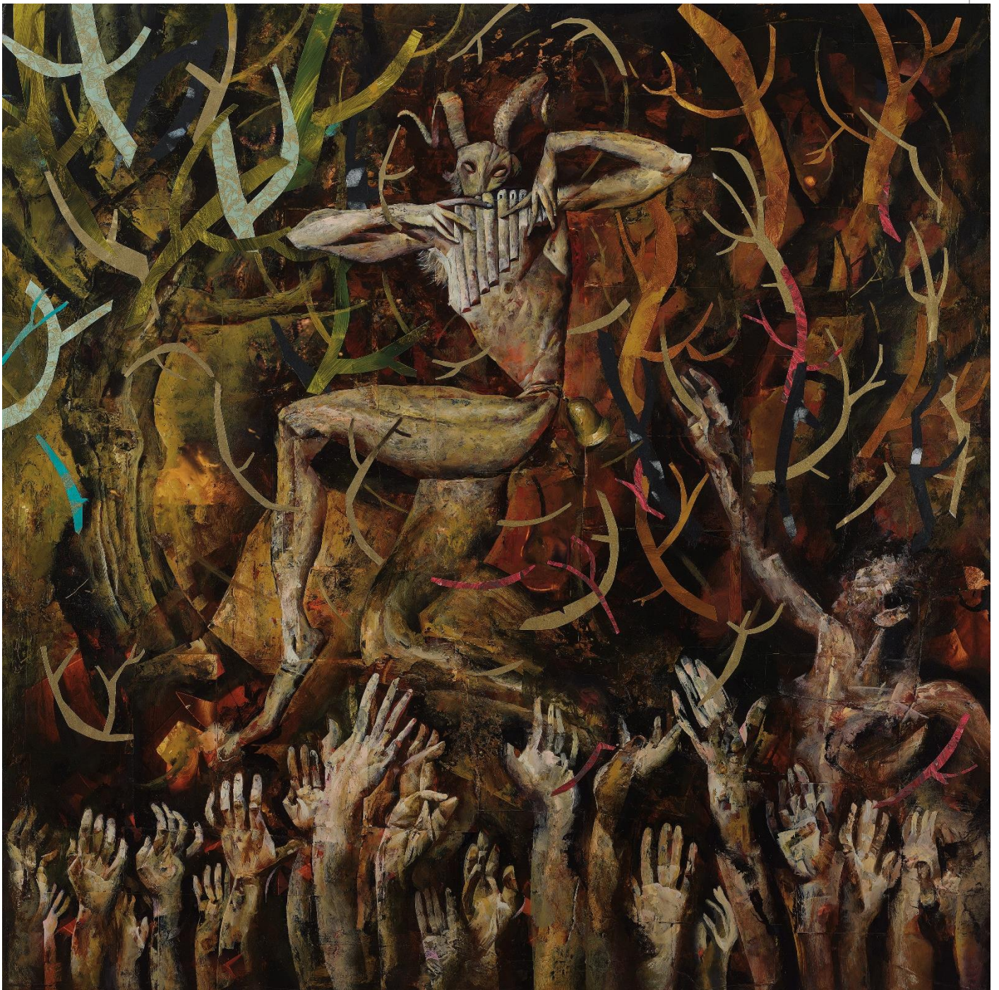
El Mago (Rex Ingram) 1926

Acrílico, collage y tierra sobre panel, 2020. 101 x 101cm