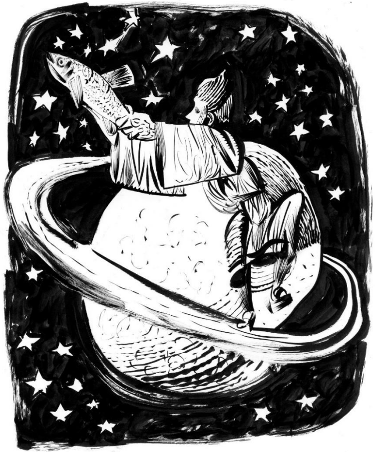
El viaje a Júpiter (Segundo de Chomón) 1909 Tinta sobre papel. 2020. 42 x 30 cm.