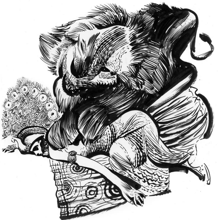
Macho y hembra (Cecil B. DeMille) 1919 Tinta sobre papel. 2020. 42 x 30 cm.