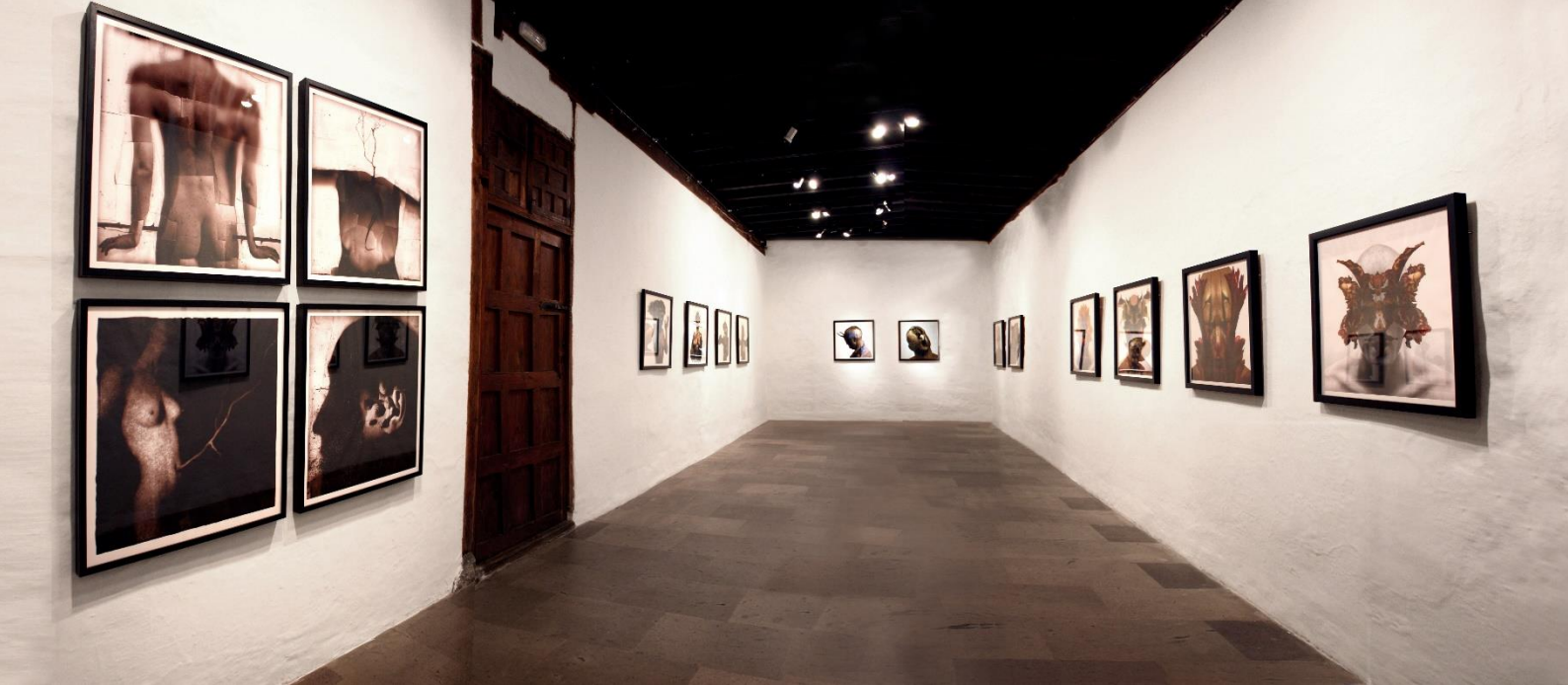
“Pholk”; primera exposición de Dave McKean en la Galería Artizar (2009)