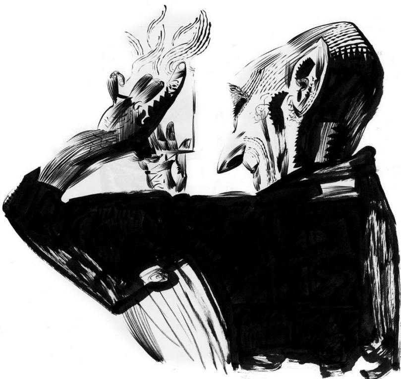
El Sexto Sentido (Eusebio Fernández Ardavín, Nemesio M. Sobrevila) 1929 Tinta sobre papel. 2020. 30 x 42 cm.